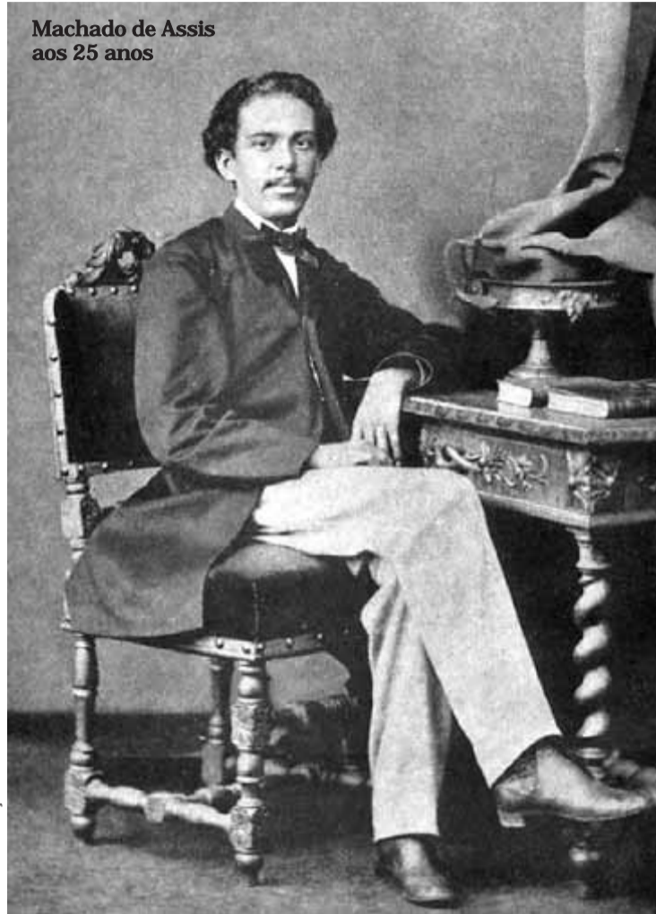
Machado de Assis aos 25 anos

Academia Sorocabana de Letras faz programação especial pelo centenário de morte de Machado de Assis